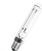
Osram Vialox NAV-T